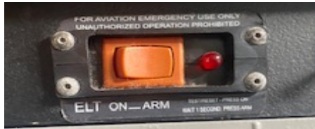
La balise du DR400 et DA40

Sur le DR400 et le DA40, c'est une ELT automatique (à l'impact), mais vous pouvez la déclencher manuellement par le switch sur le tableau de bord.