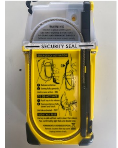
Les balises des DA20